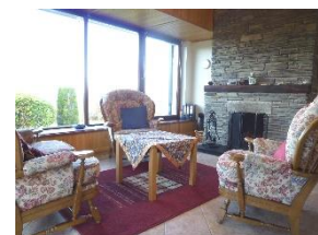
Wohnraum, offener Kamin