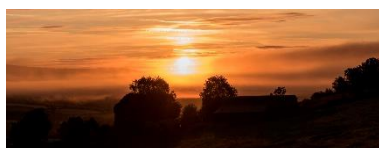
Blick aus dem Schlafzimmerfenster von Haus Klara: Sonnenaufgang