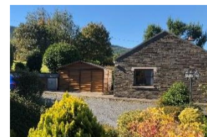
Auffahrt zu Cottage Miriam und Parkplatz für 5 PKW sowie Geräteschuppen