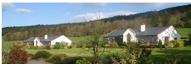
Mount-Leinster-Cottages, links: Haus Klara 123,9 m², Wohnfläche rechts: Haus Miriam 91,5 m², Wohnfläche