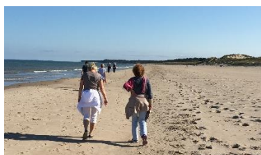
Ein breiter feiner Sandstrand an der Irischen See (Kilmuckridge) ist nur ca.45 km von Kildavin entfernt